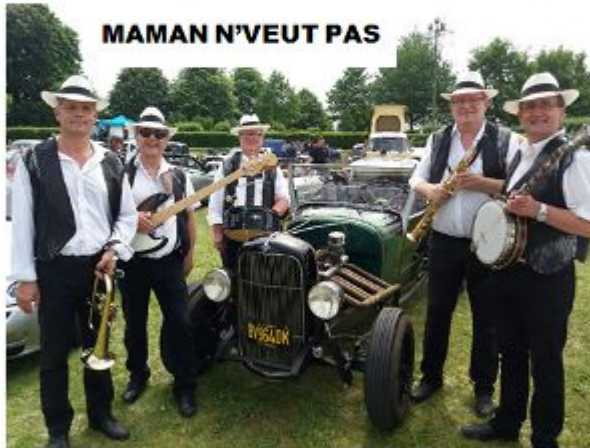
MAMAN N'VEUT PAS

Soirée dansante : D.J. »PRO'logic sonorisation «